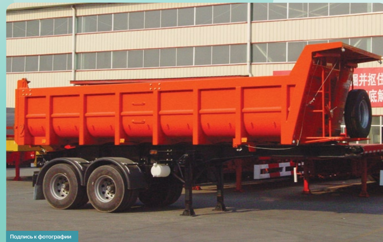
Подпись к фотографии

Боковые стенки кузова самосвального полуприцепа изготавливаются из качественной стали толщиной не менее 8ми миллиметров, днище не менее 10 мм.